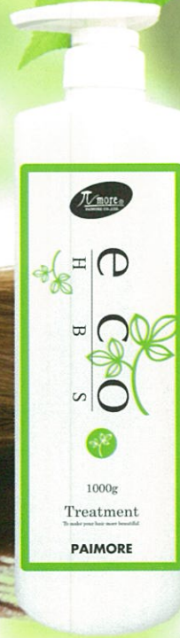
エコエイチビーエス トリートメント 1000g 1,600円(税抜)

弱酸性。 イオンバランスを整え、洗い上がりを なめらかにしました。 少量で豊かな泡立ち。 操作性に優れており、泡切れとクシ 通りの良さが抜群です。