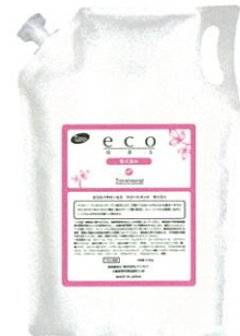
エコエイチビーエス トリートメント モイスト 5kg(2.5kg×2個入)