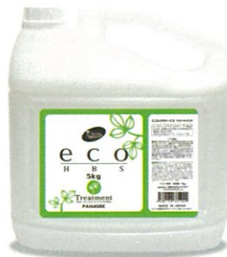
エコエイチビーエス トリートメント 5kg