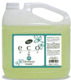
エコエイチビーエス シャンプー 5L